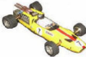
1966 McLaren M2B F1 Lancer (?)