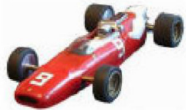
1966 Ferrari 312 F1 Pactra eller Dubro