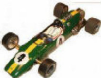
1965 Lotus 33 Howmet