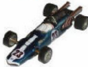
1967 Eagle Weslake F1 Lancer eller Dynamic