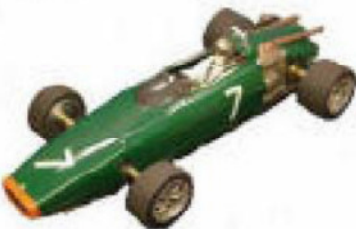
1967 BRM P83 H16 F1 Lancer