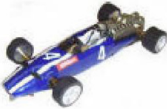
1966 Cooper T81 Maserati Lancer