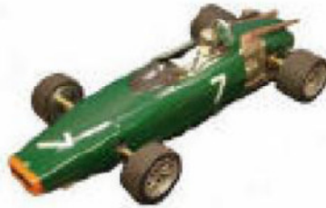
1966 BRM P83 H16 F1 Lancer