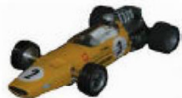
1967-69 McLaren M7 Betta + Howmet