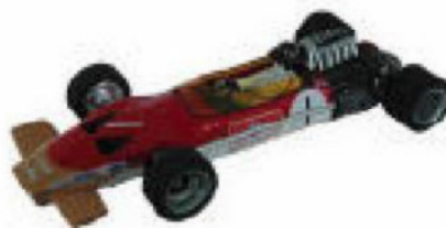
1967-69 Lotus 49 + 49B Howmet