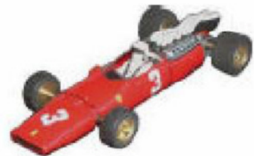
1967 Ferrari 312 F1 Lancer eller Howmet