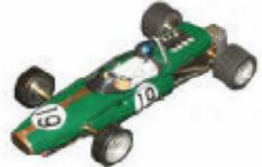
1966 Brabham BT20 Repco Lancer