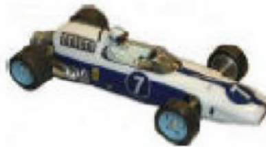
1964 Ferrari 512 Howmet