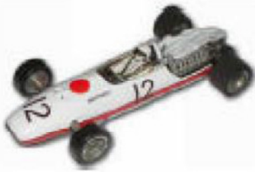
1966 Honda RA273 F1 Russkit eller Lancer